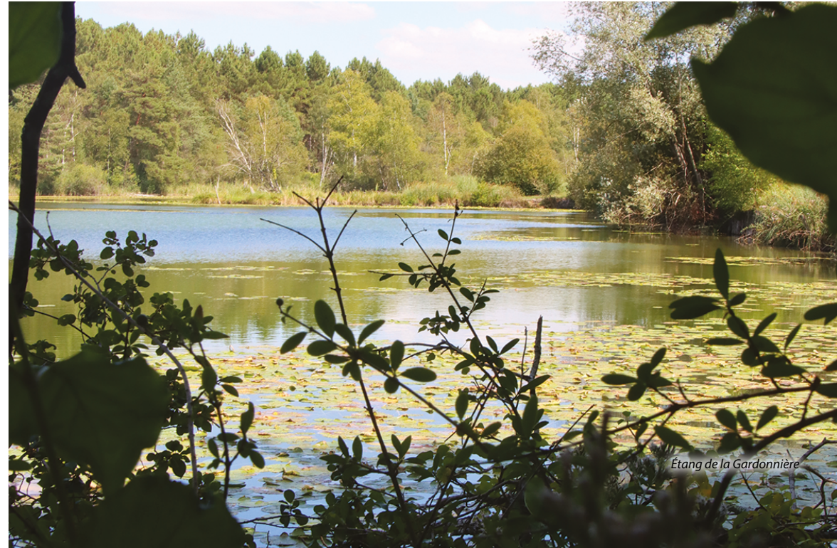
Étang de la Gardonnière

Si vous souhaitez faire la randonnée entière, tournez à gauche après le Gué de l'Aune pour suivre le chemin en terre qui mène vers les étangs de la Gardonnière. 3 Après le passage à gué, où votre cheval pourra s'abreuver, 4 continuez jusqu'au carrefour de la Maigretière où vous traversez la route. Après avoir passé le Pignon Vert, vous apercevrez sur votre gauche le Moulin du Frêne où vous prenez à droite vers 5 la Ruelle aux loups. Après 1,5 km, quittez le balisage violet pour tourner à gauche et continuez tout droit jusqu'à la route bitumée où vous prenez le chemin de terre qui se trouve en face, puis le chemin des Tremblays à droite (petit panneau indiquant le lieu-dit), après la maison qui fait l'angle. Traversez la route des Bouveries, rejoignez le chemin en herbe qui se trouve en face et au bout du